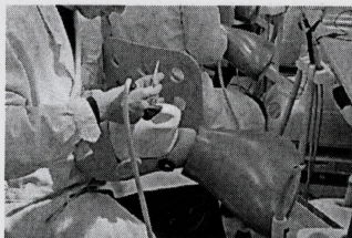
图一. 实习用仿头模